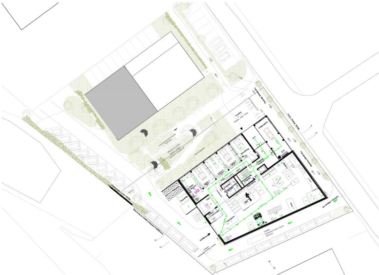
Abbildung 2: Im Grundriss ist das Erdgeschoß sowie die Außenanlagenplanung abgebildet (diese Darstellung zeigt einen aktuellen Status, der sich im Projektverlauf noch ändern kann)