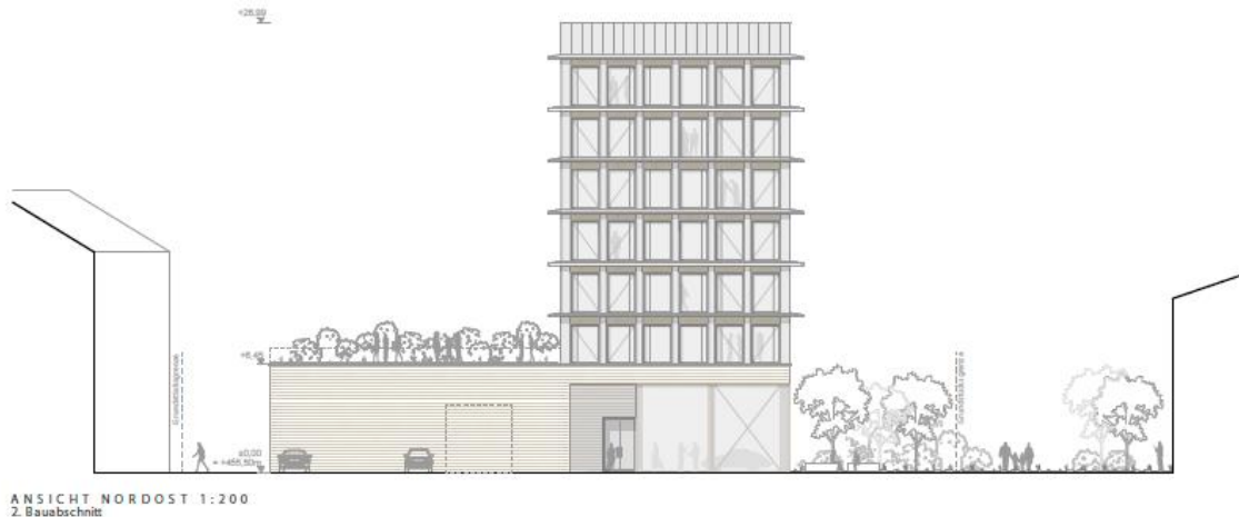
Abbildung 5: Ansicht Gebäude im Vollausbau