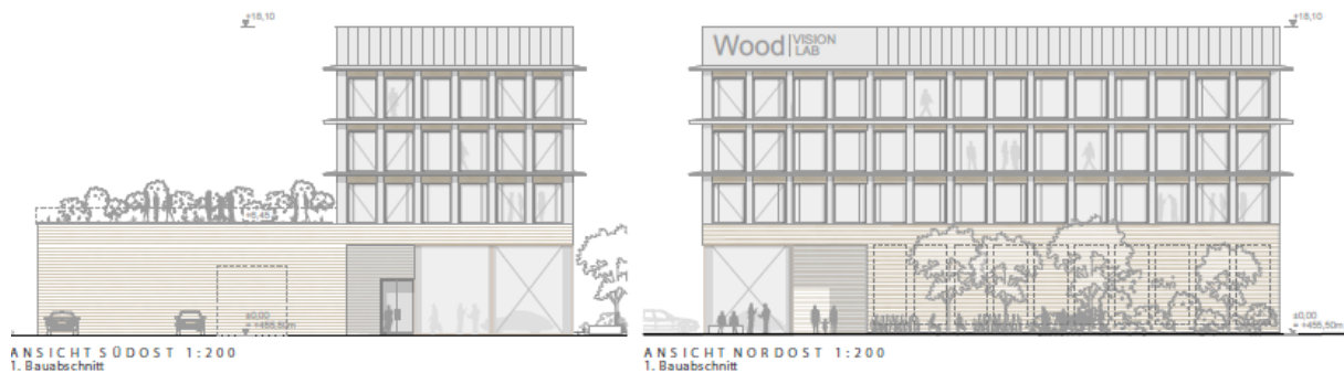
Abbildung 1: Ansicht Gebäude im ersten Bauabschnitt

Die drei darüber angeordneten Geschosse (der Akzelerator) beinhalten Büroflächen in einem Umfang von ca. 1.300 m 2 Nettogeschoßfläche.